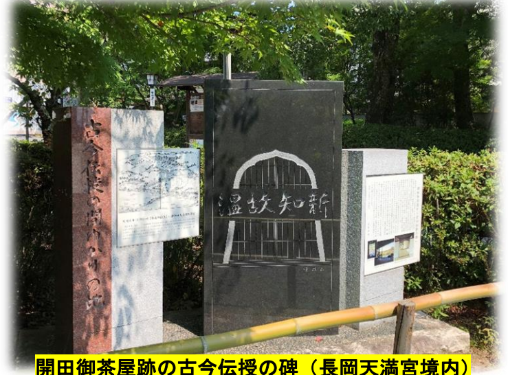
開田御茶屋跡の古今伝授の碑(長岡天満宮境内)